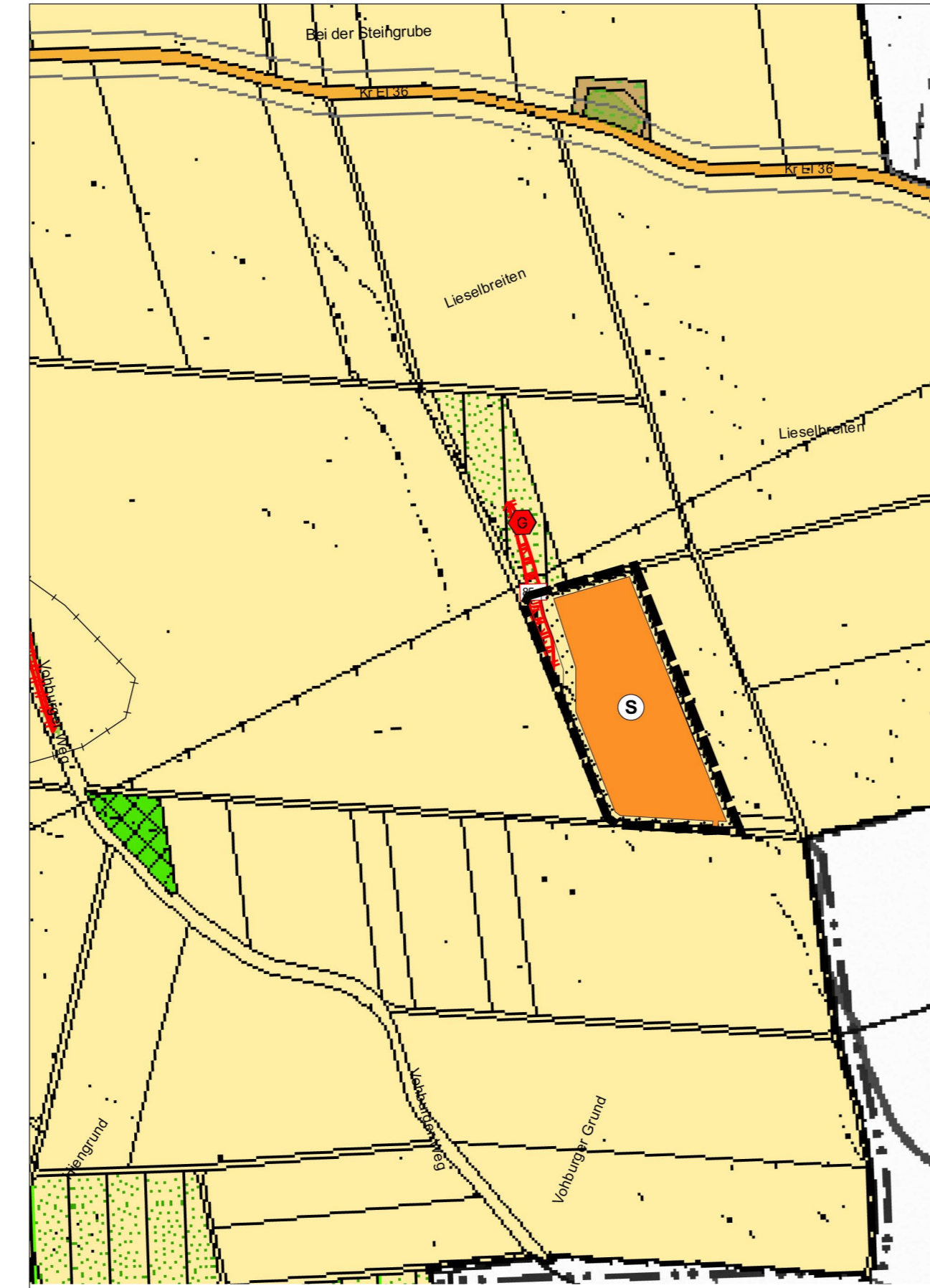
Kartengrundlage: Flächennutzungsplan, digitalisierte Fassung